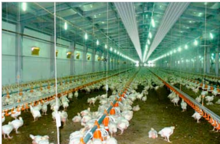
Рис. 2. Стельова опалювальна система у пташнику по вирощуванню бройлерів (реконструкція)